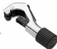
D. y E.